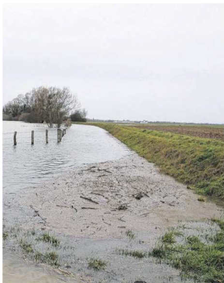
La digue du Pommeret le 30 janvier dernier.

En fin de réunion, une proposition de visite des digues a été faite aux membres de la réserve, elle sera effectuée dans les prochaines semaines.