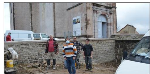
Le maire est venu constater l'avance des travaux.

Les travaux de restauration du mur de soutènement de l'église, classée monument historique, devenaient évidents. Dans le prolongement rue du Lavoir, il présentait un état de délabrement important. Les travaux ont été réalisés par l'entreprise Recobart de Moisey, le montant des travaux s'élève à 21 228 euros. La commune a reçu l'aide de l'État