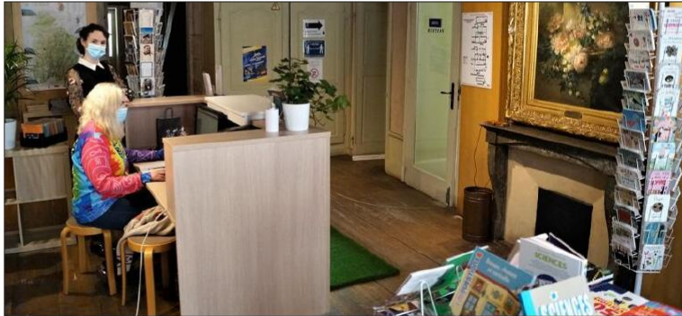
Les agents d'accueil, également médiatrices scientifiques, Estelle Trillot et Olga Myronova sont désormais face aux visiteurs dès leur entrée.

Pour autant, les agents d'accueil, également médiatrices et animateurs scientifiques, ne sont pas restés inactifs et ont participé aux travaux de réaménagement de la boutique et de l'accueil de la maison natale du sa-