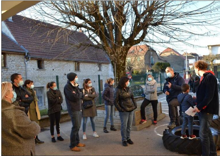
Pendant la première réunion avec les parents, les membres de l'Association des parents d'élèves (APE) et le maire.

Samedi 27 février, élus et parents se sont rassemblés pour élaborer et coordonner leur action. « Les élus des communes appartenant au Regroupement pédagogique (RPI Orchamps, Our, La