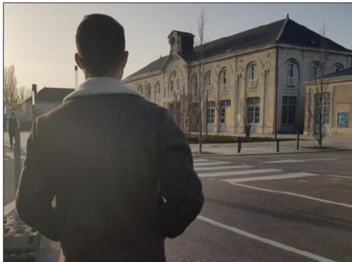
Un mineur scolarisé à Duhamel a été violemment agressé mercredi 24 février.

Les faits se sont produits ce mercredi 24 février. Un mineur scolarisé au lycée polyvalent Jacques-Duhamel, à Dole, a subi une violente agression, près de la gare, en début d'après-midi. Dans ce quartier très fréquenté par les lycéens et les collégiens, y empruntant différentes lignes de bus et de train du lundi au vendredi, une scène ressemblant à de la torture a eu lieu ce mercredi. Selon les premiers éléments que Le Progrès a pu recueillir, le jeune garçon aurait été déshabillé et séquestré par deux autres mineurs. Des coups lui auraient également été portés. Une ITT (incapacité totale de travail) lui a notamment été attribuée, confirme le parquet.