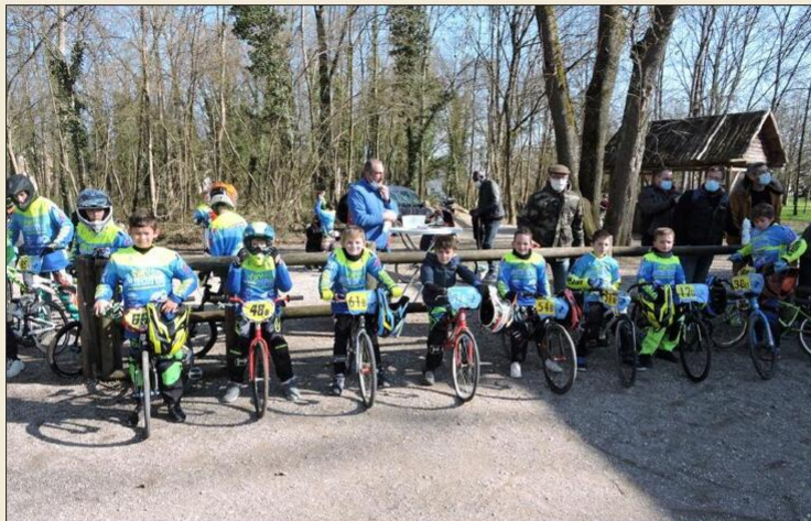
Environ une dizaine de jeunes débutants sur un total de 40 participants à ce rassemblement de la section BMX de l'ACSTR.