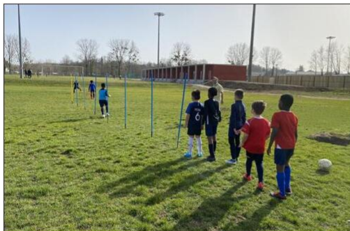
Les jeunes footballeurs du PSDC effectuent des entraînements par groupes avec leurs entraîneurs sur les terrains du Pasquier.

Sans vestiaire mais avec les chaussures de football au pied, les jeunes footballeurs du PSDC ont retrouvé les terrains de foot du Pasquier depuis la mi-février.